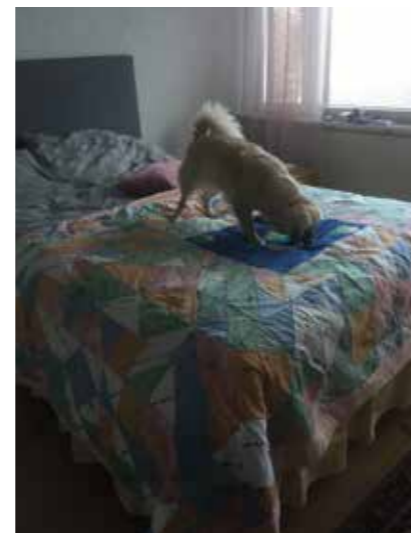
Koti ja Juuret -Kuvat: Maaretta Riionheimo &amp; vuosaarelaisten kotialbumit

"Mä oon ulospäin suuntautunut ja yhteiskuntaan suuntautunut, mulle tärkeää on että mä voin tulla kotiin. Kun mun mies kuoli niin oli ikävää tulla ku ei oo ketään. Mutta sitten Mikko tuli, se on tärkeä osa kotia."